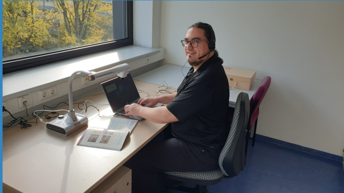
Herr [REDACTED] bei der Arbeit